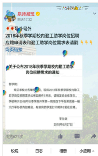
图17: QQ空间校园资讯页