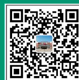
招生微信公众号二维码