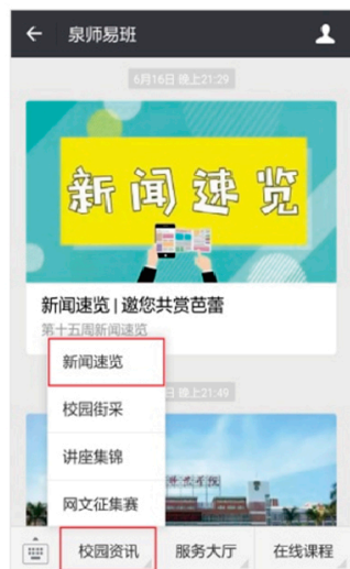
图16: 公众号校园资讯页