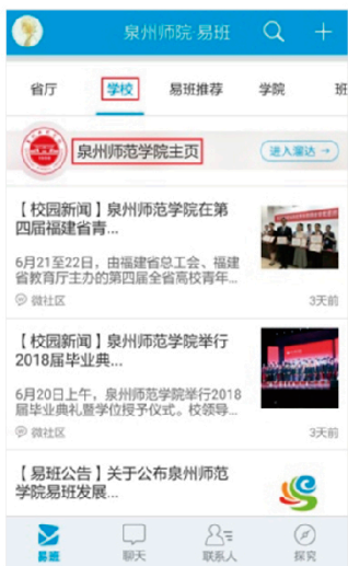
图15: 易班APP校园资讯页

四大新媒体平台主页定期推送综合校园资讯，同学们可以通过易班APP校园主点击“学校”查看，或打开微信公众号，点击小菜单“校园资讯”查看，也可以进入QQ空间或微博查看，如图15-17。