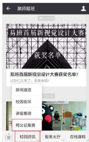
图19: 公众号网络活动入口