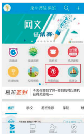
图18: 易班APP网络活动入口

易班熊常年组织开展丰富多彩的网络文化活动，在易班校园主页的快捷应用可以找到活动入口，也可点击公众号的“校园资讯”和“服务大厅”菜单查看，如图18-19。这里重点推荐“易班网文征集赛”，该活动为大家创设了网文投稿平台，长期面向全校同学征集原创博文，每周评审，获奖文章将获得丰厚稿酬，并有机会被推送在各大平台首页。